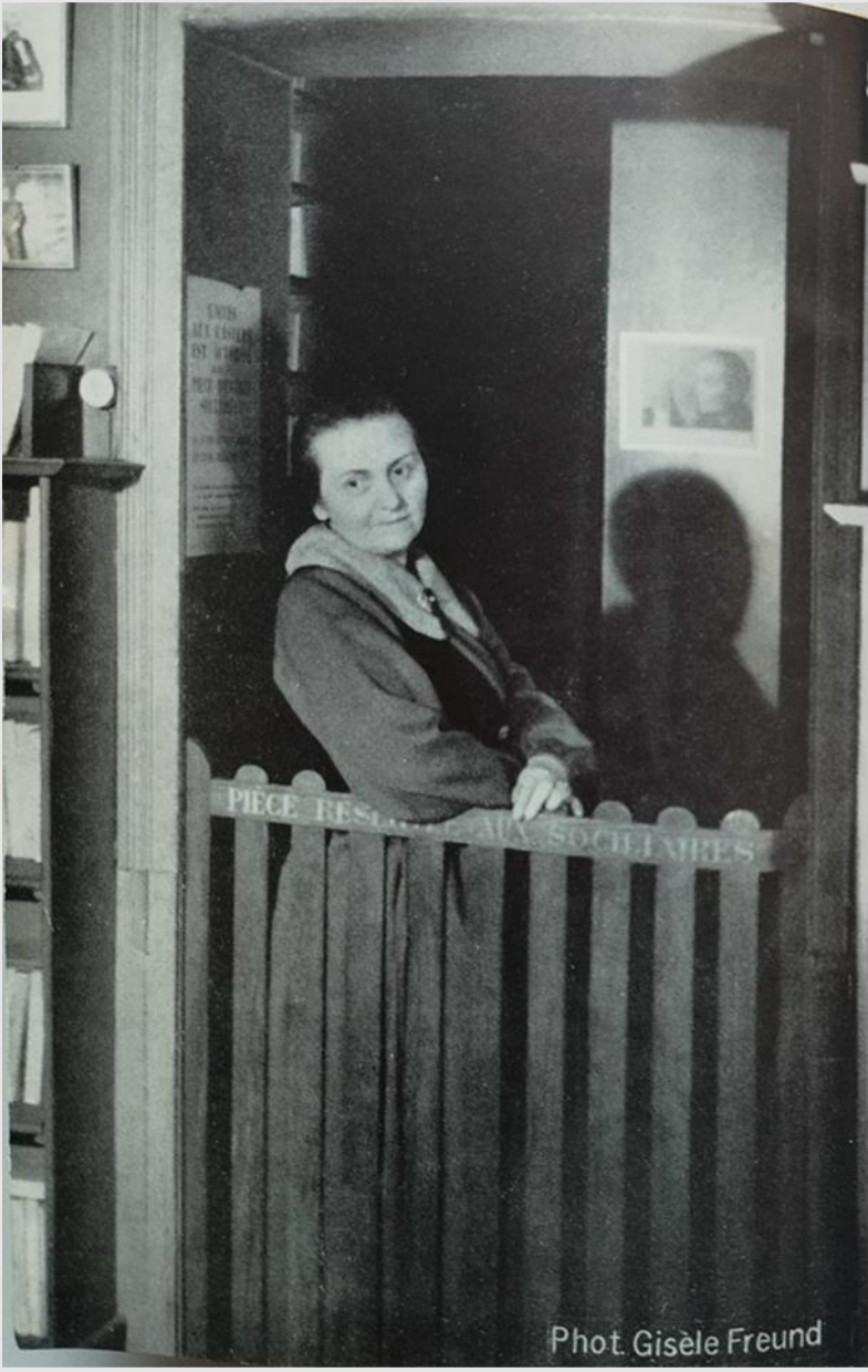
Fotografia: Gisele Freud Extreta del llibre: Rue de l'Odéon. Éd. Albin Michel, 1960 1 er Ed