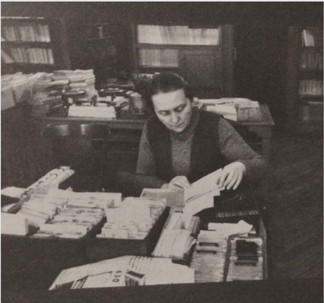
Fotografia: Gisele Freud Extreta del llibre: Adrienne Monnier & la Maison des Amis des Livres Éd. IMEC 1991, Pàg. 48